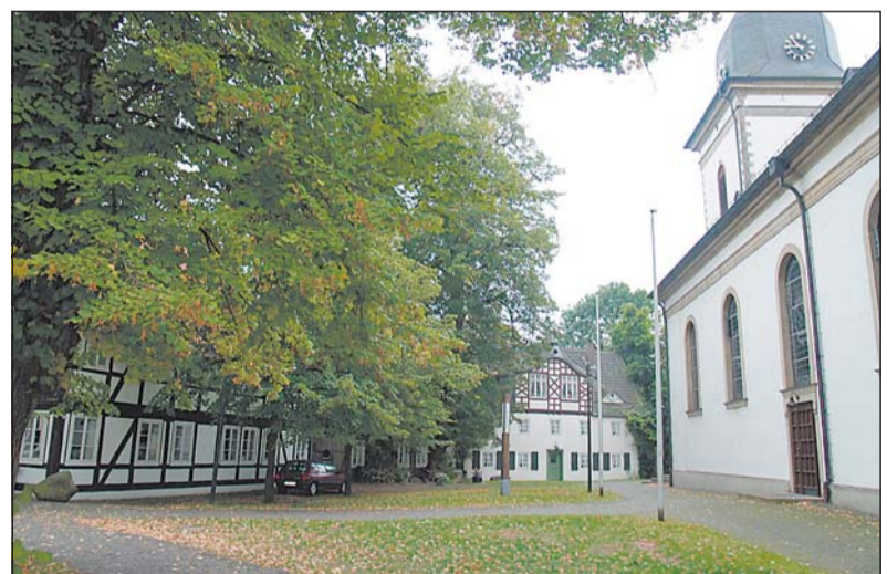
Der Kirchplatz mit den hohen Bäumen und den schönen Fachwerkhäusern soll dem Adventsmarkt ein besonderes Flair geben.

Verbunden werden soll der Adventsmarkt mit einer Krippenausstellung im Heimathaus.